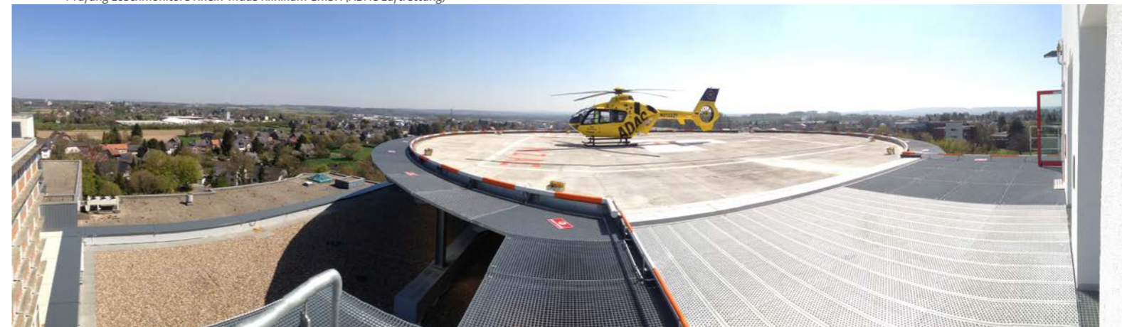
Prüfung Löschmonitore Rhein-Maas Klinikum GmbH (ADAC Luftrettung)